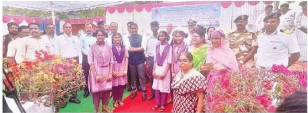
VPA officials celebrate the 62nd 'National Maritime Day' with a host of events in Visakhapatnam on Saturday