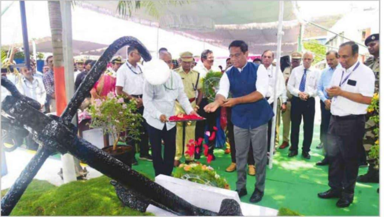
సముద్ర దినోత్సవంలో పాల్గొన్న పోర్టు చైర్మన్ అంగముత్తు