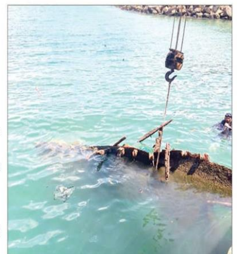
A sunken boat being removed by Visakhapatnam Port Authority at the fishing harbour on Wednesday

The removal process involves complex underwater operations, including videography, the use of specialized underwater cutters, and de-silting the debris with high-capacity generators and compressors. Skilled divers have been deployed to carefully execute the task, prioritising safety and security at all times.