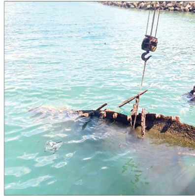
A sunken boat being removed by Visakhapatnam Port Authority at the fishing harbour on Wednesday

A total of six fishing trawlers and 11 boats, which had long been submerged in the seabed, were identified with the help of the local fishing