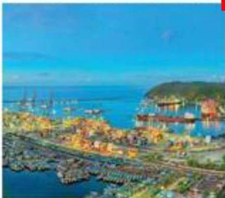
A view of Visakhapatnam Port

The improved rankings also highlight VPA's pivotal role in facilitating trade and economic growth, both regionally and internationally.