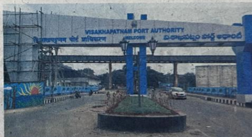
Visakhapatnam Port Authority registered its record cargo handling volume of 50 million metric tonnes in Visakhapatnam